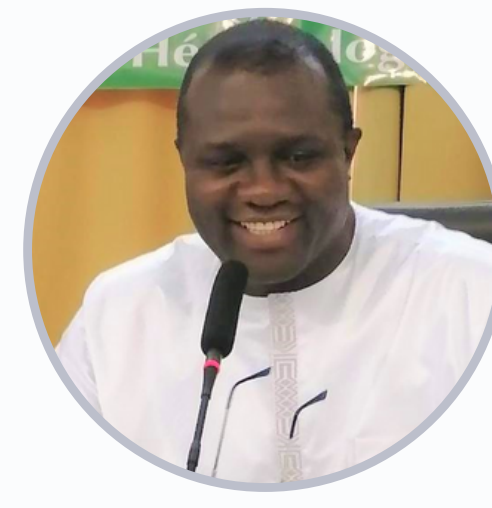
Pr. Papa Moctar Faye